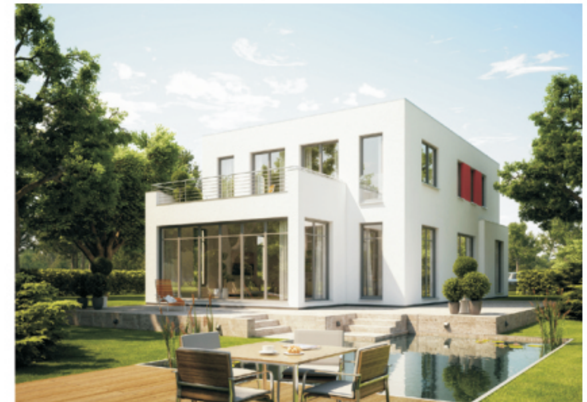
Abbildung mit Sonderbauteilen

(Auf Kundenwunsch durch unsere Hausbank)