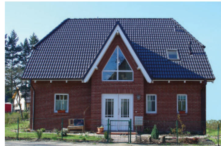
Abbildung mit Sonderbauteilen

( Auf Kundenwunsch durch unsere Hausbank)